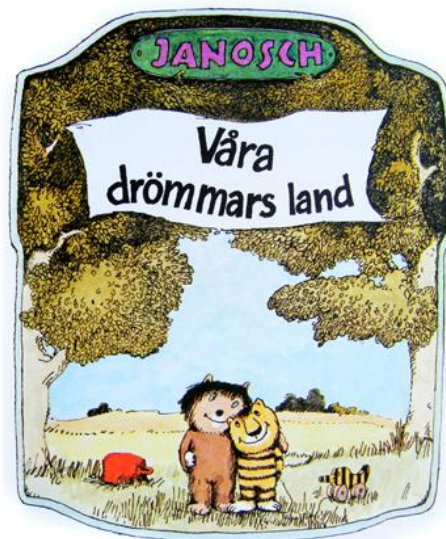
Berättelsen om när lilla Tiger och lilla Björn gick till Panama